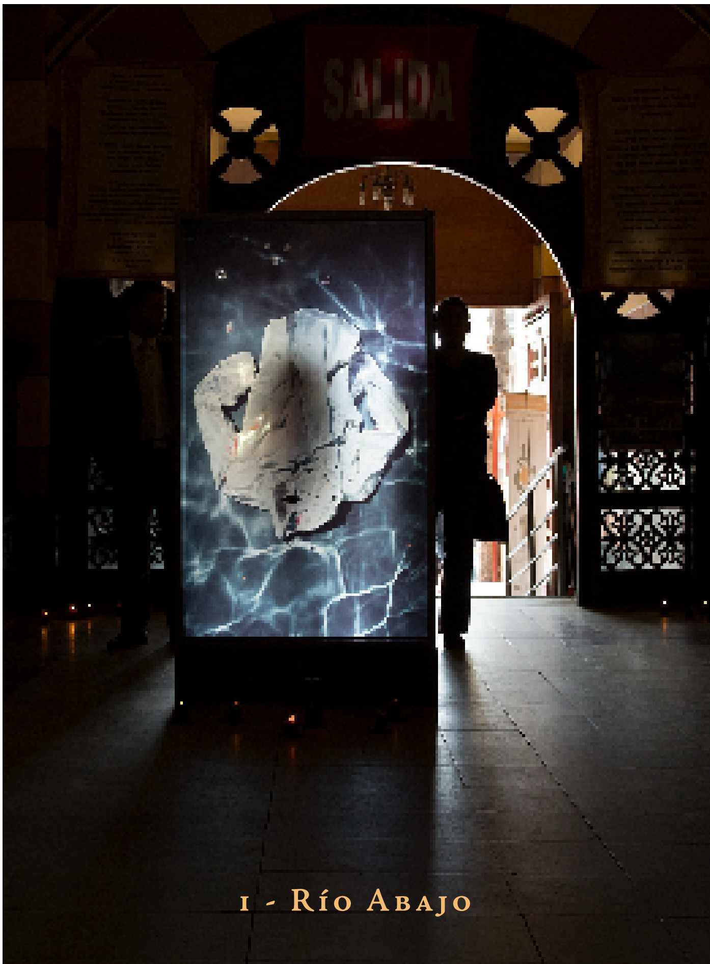
I - RÍO ABAJO