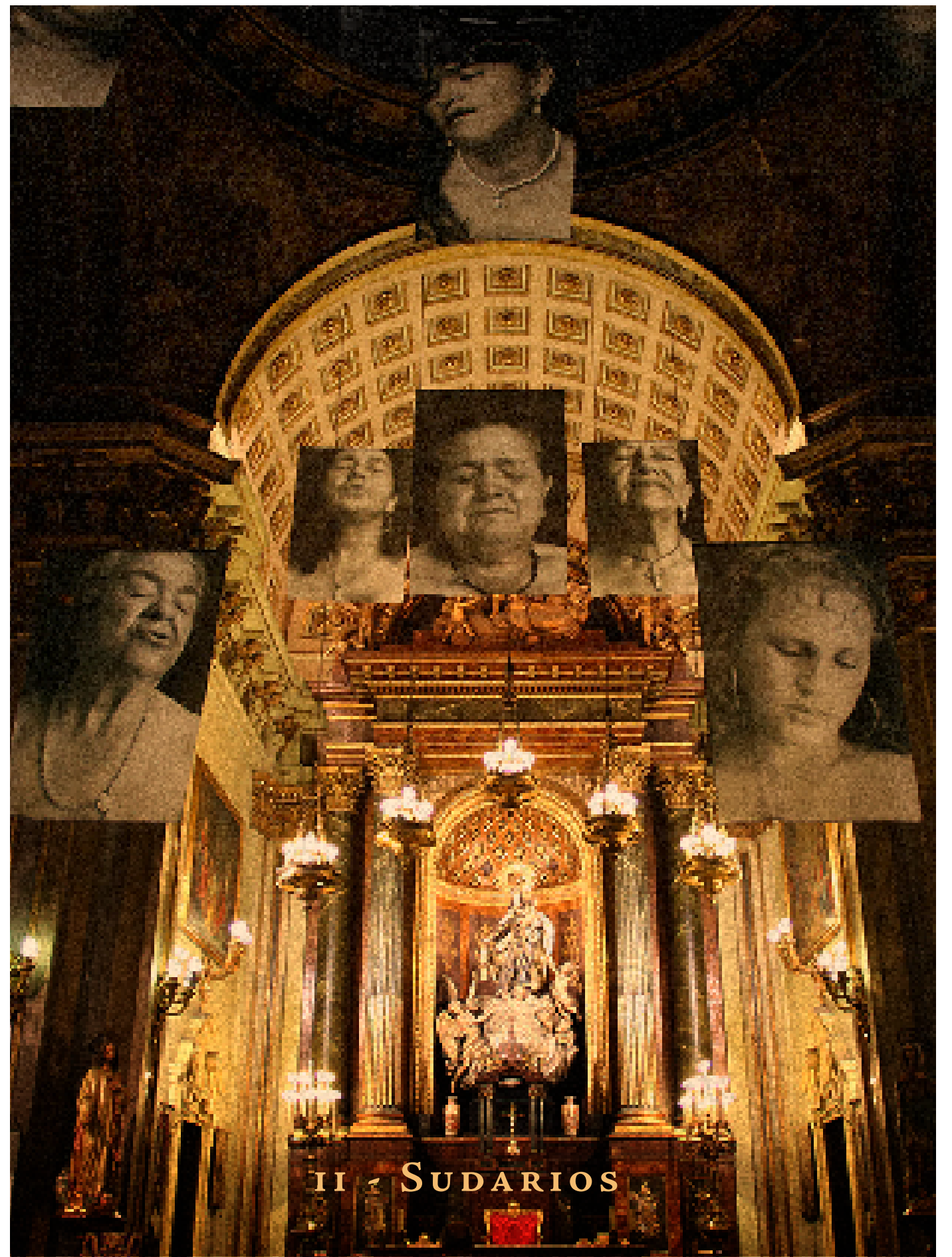
II - SUDARIOS