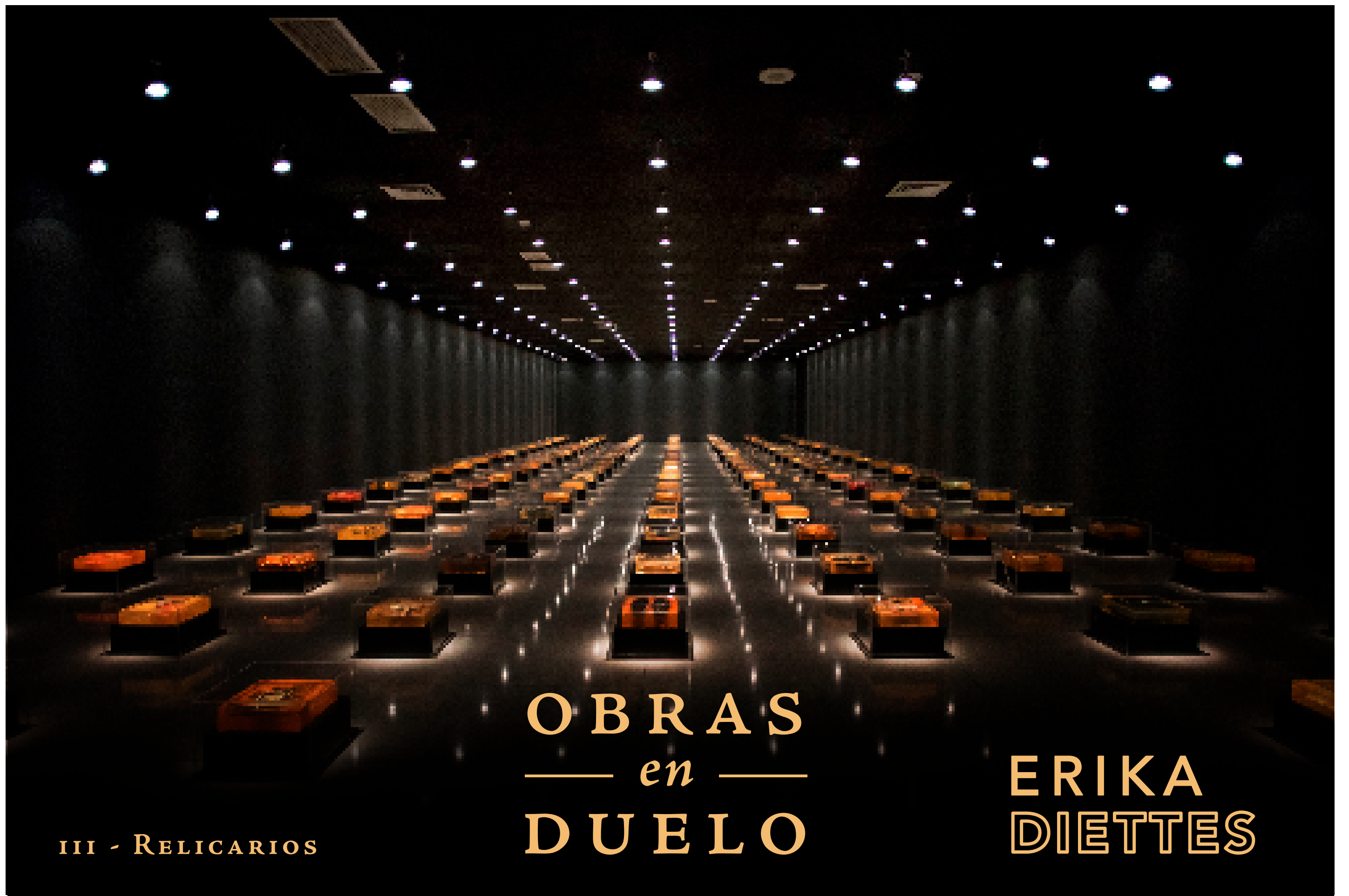
III - RELICARIOS